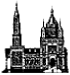
Православный храм и его части:

Алтарь – место особое, святое, главное. Там располагается престол, на котором совершается Таинство святого причащения. Алтарь – это святая святых православного храма, образ Царства Небесного, места горнего, возвышенного. В алтарь обычно ведут три двери.