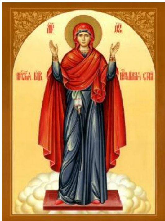
Икона Божией Матери «Нерушимая стена» являлась не раз и помогала защитникам Отечества

Победа в Великой Отечественной Войне была не только физическим спасением народа, но и возрождением его духа. Вспомним, что война началась 22 июня - в день Всех Святых, в земле Российской просиявших, и смысл этой мистической даты лучше всего выразил местоблюститель митрополит Сергей в своем знаменитом обращении: «Фашиствующие разбойники напали на нашу Родину – попирая всякие договоры и обещания, они внезапно обрушились на нас, и вот кровь мирных граждан уже орошает родную землю».